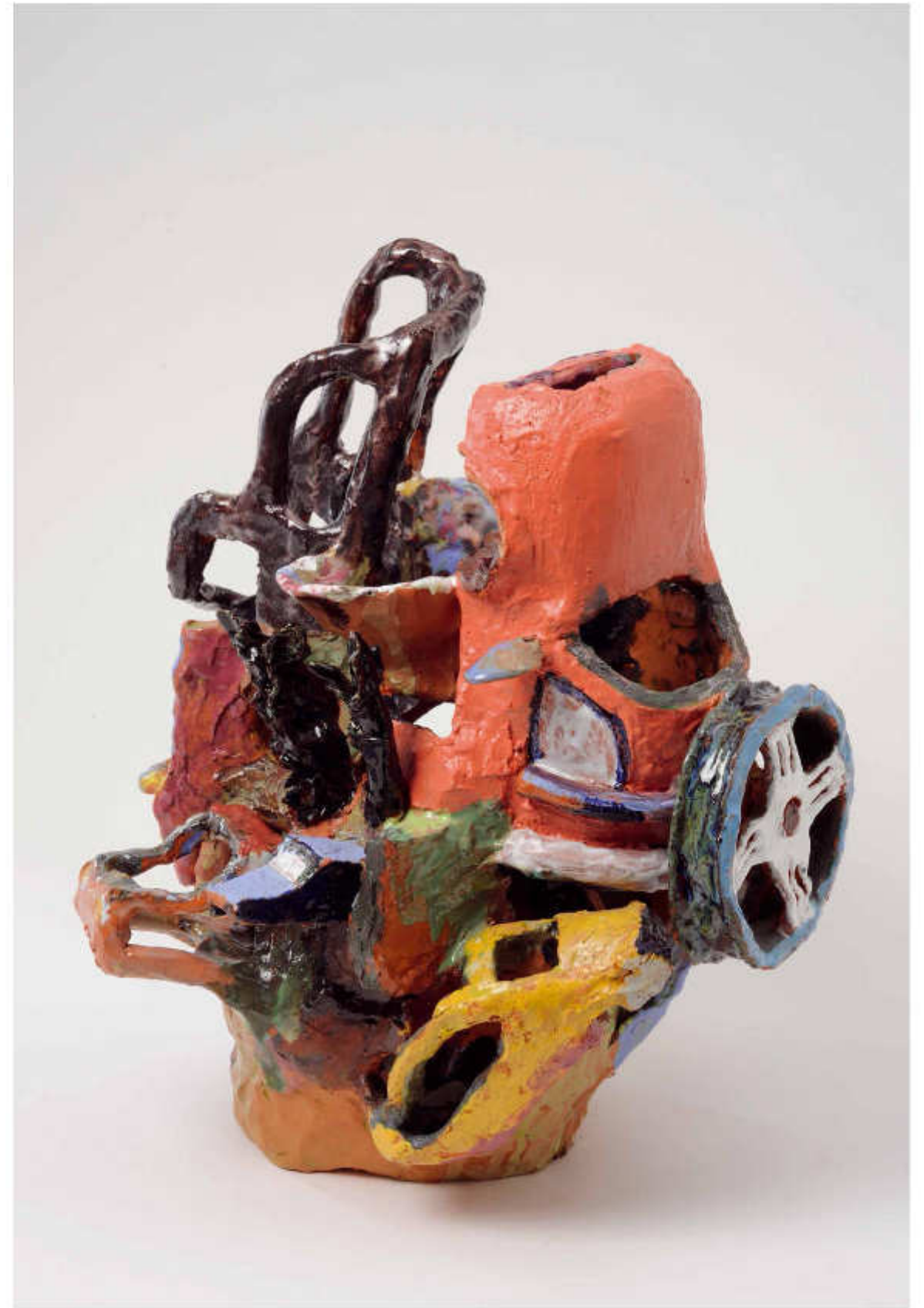
16/24 Autoblüte Höhe: 42 cm