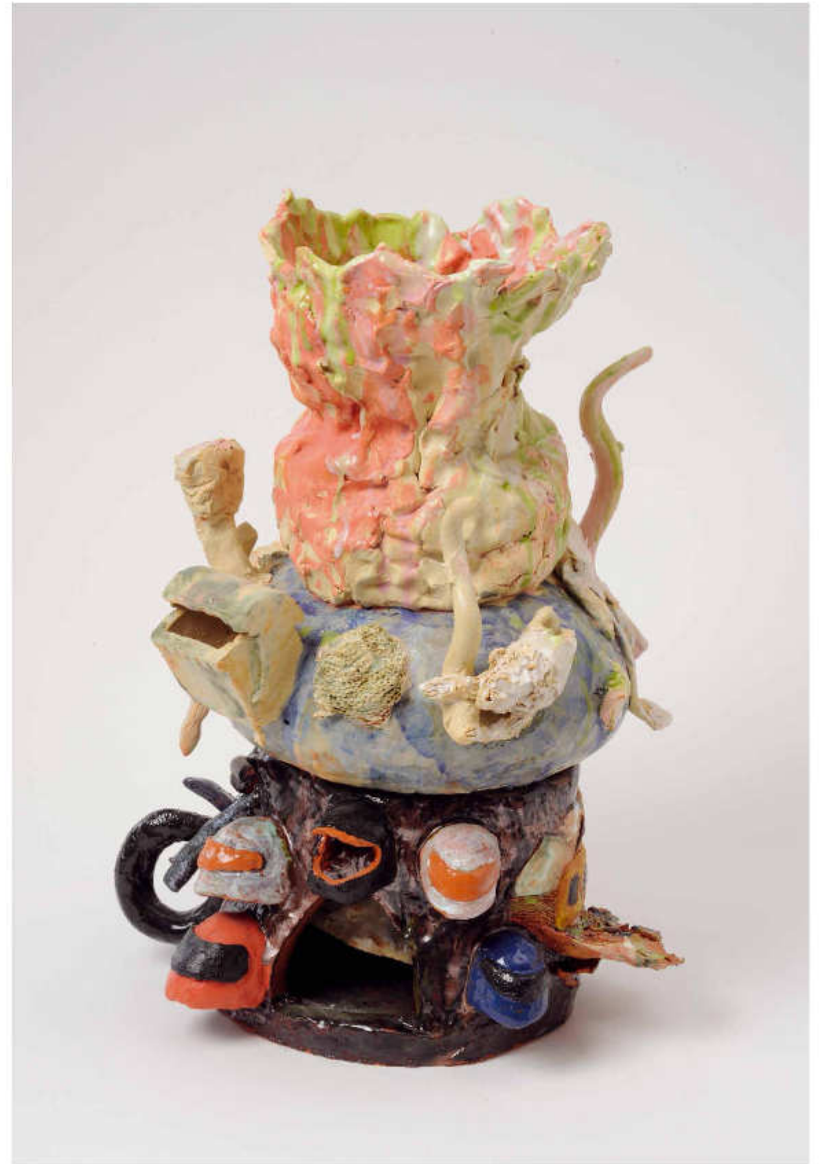
21/24 Paradies Höhe: 40 cm