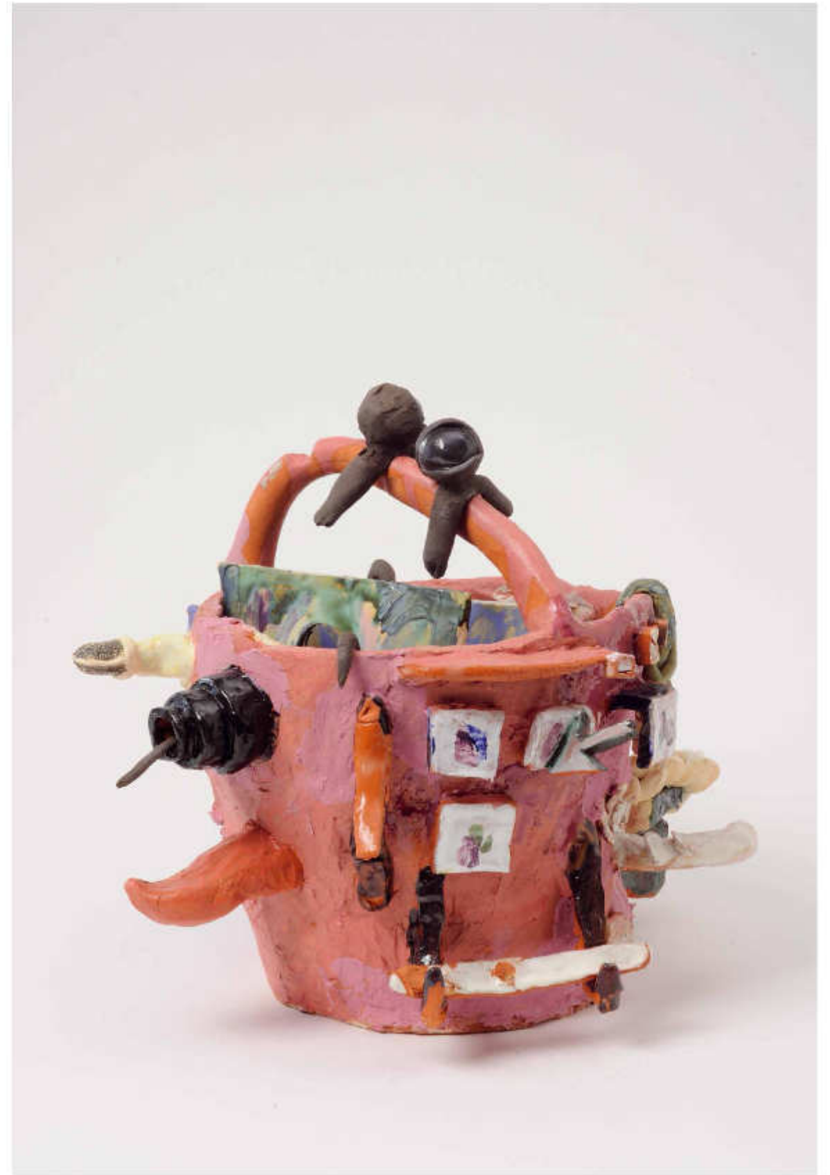
20/24 Slideshow mit Orgelmusik Höhe: 33 cm