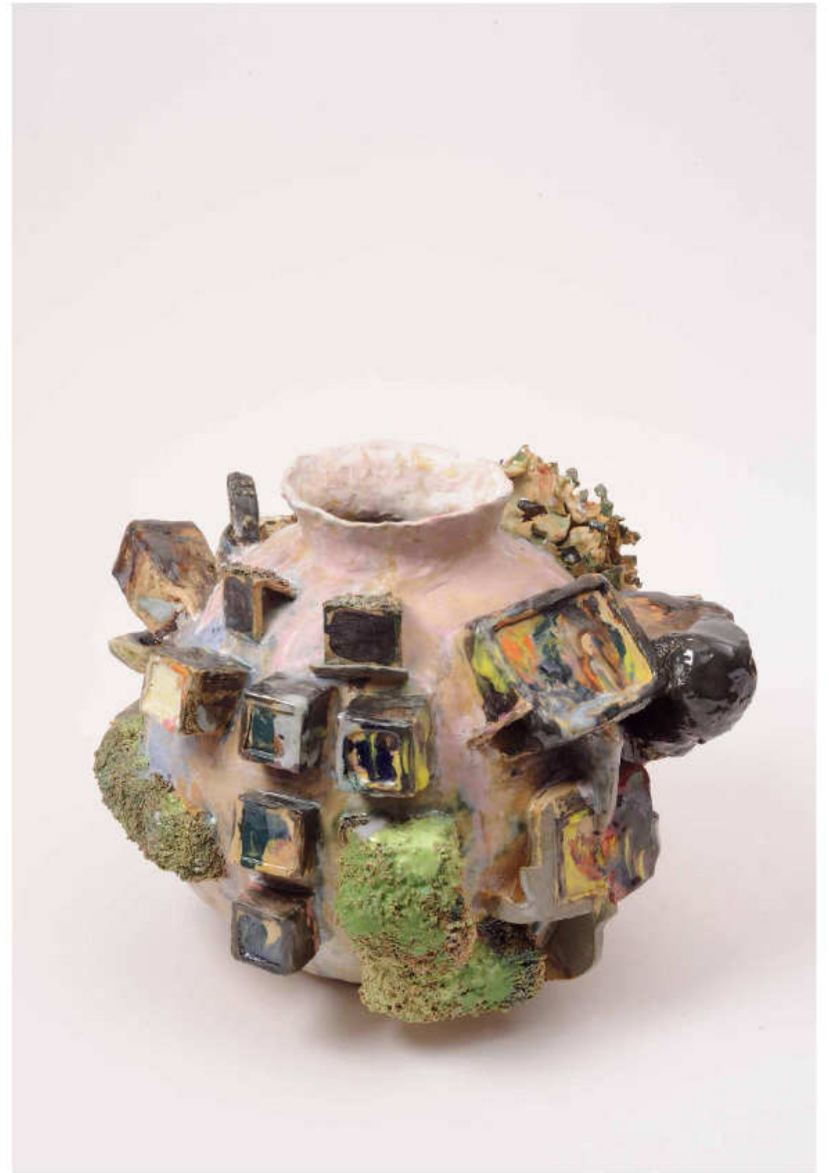
5/24 Eden Saturn Höhe: 30 cm