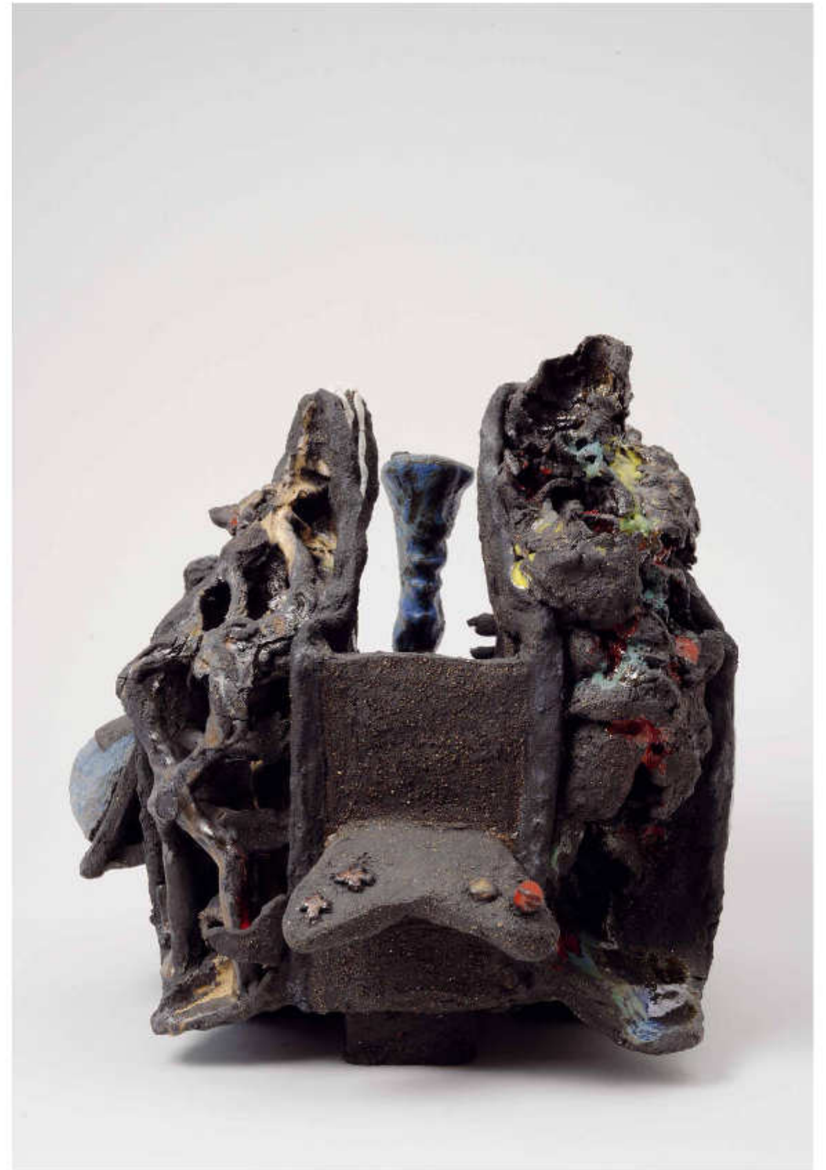
15/24 Eruptions-iPod Höhe: 36 cm