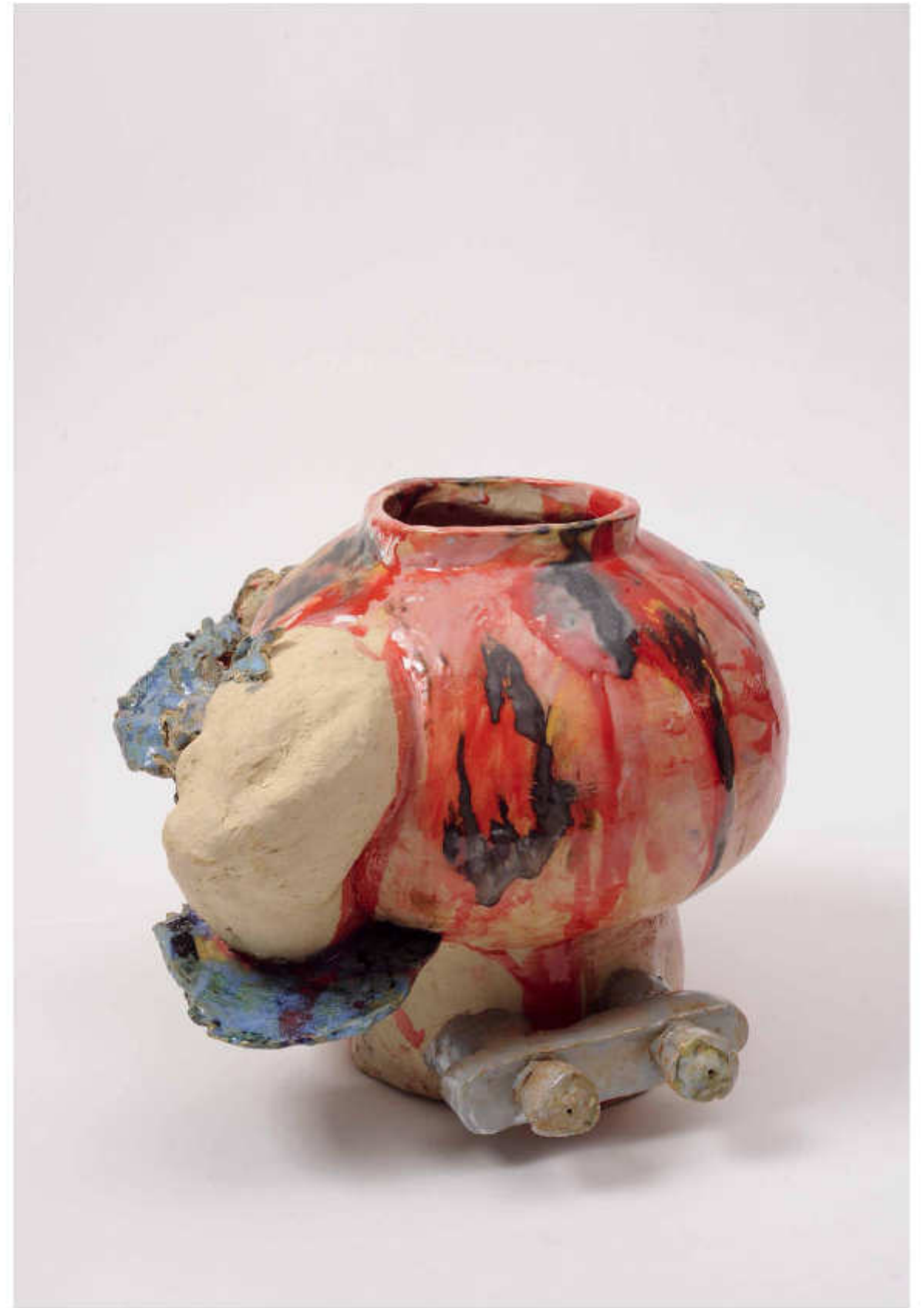
4/24 Heiße Dusche Höhe: 27 cm