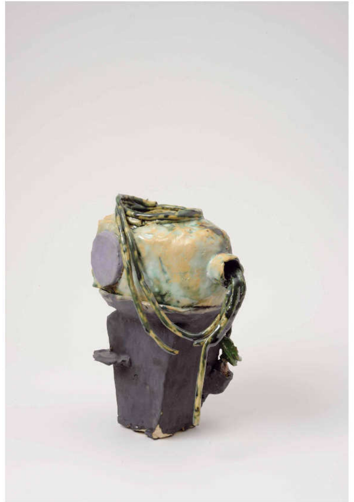
6/24 Staubsauger Höhe: 30 cm