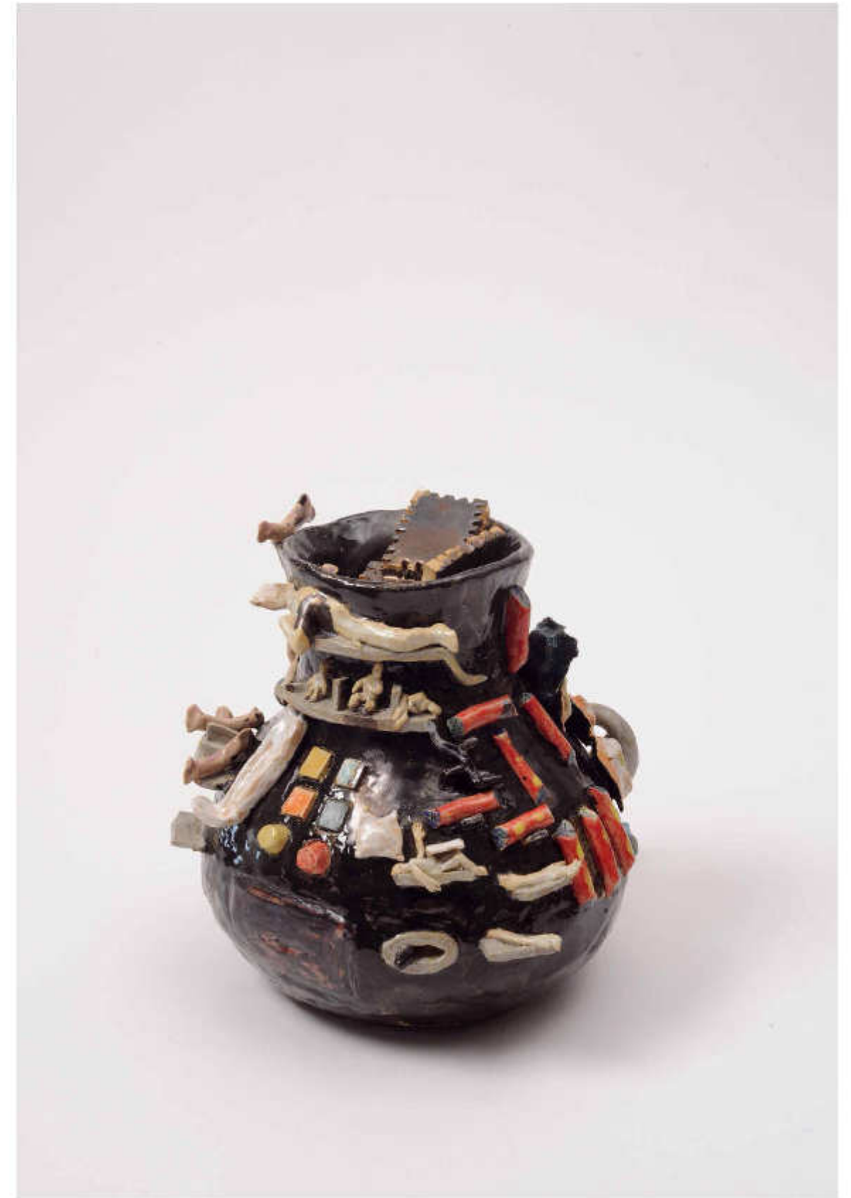
12/24 Süßigkeitenautomat Höhe: 24 cm