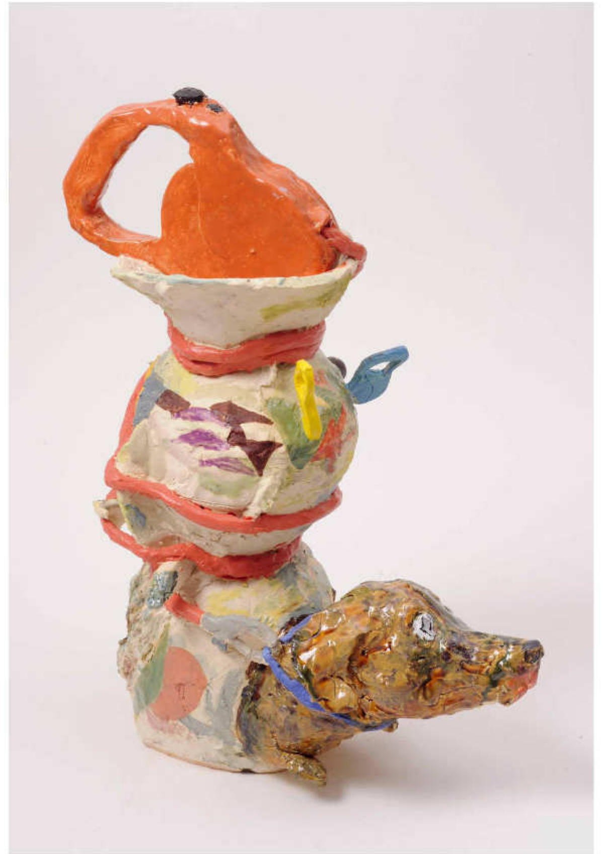
7/24 Schillerpark Höhe: 50 cm