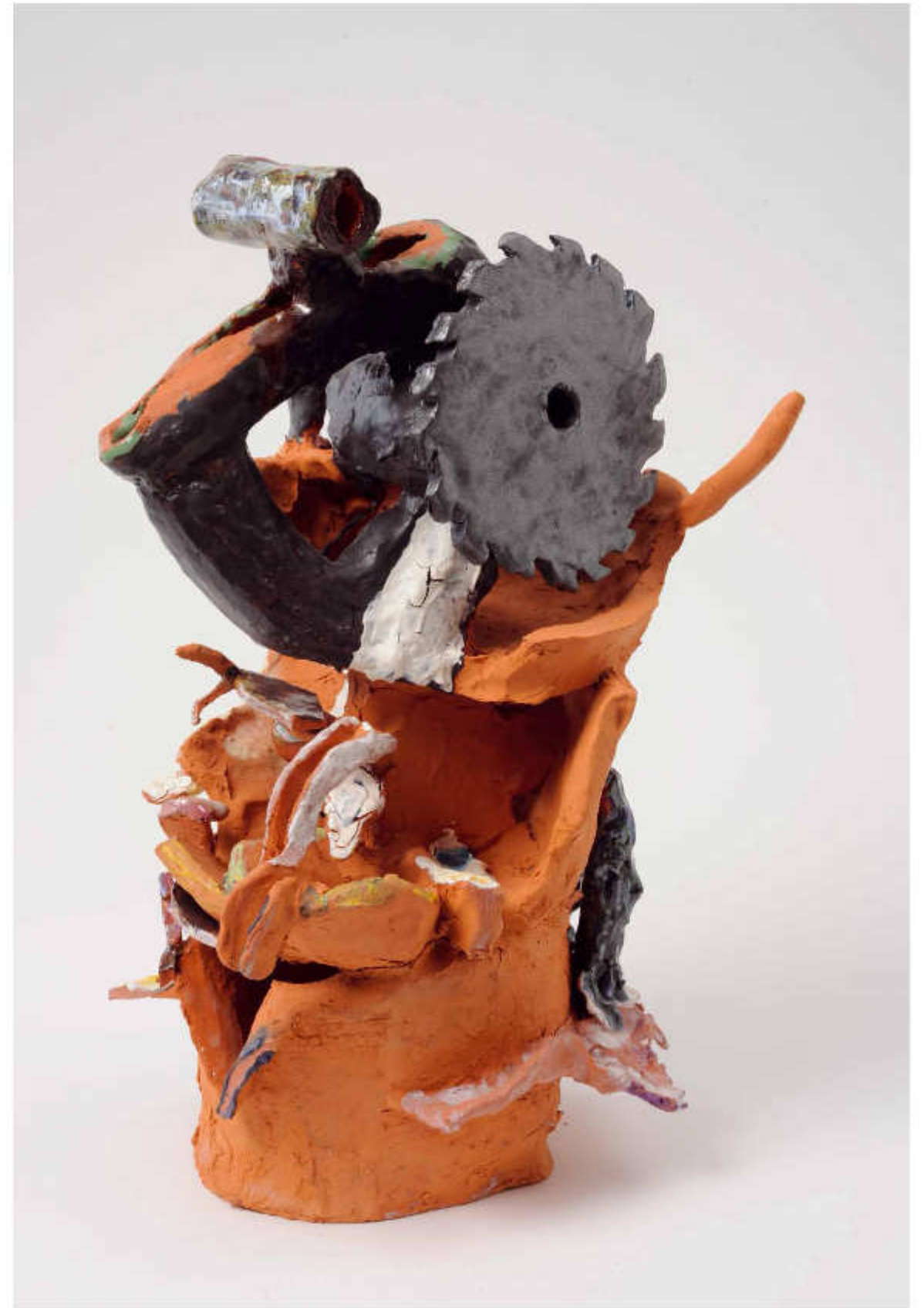
17/24 Im Sägewerk Höhe: 43 cm