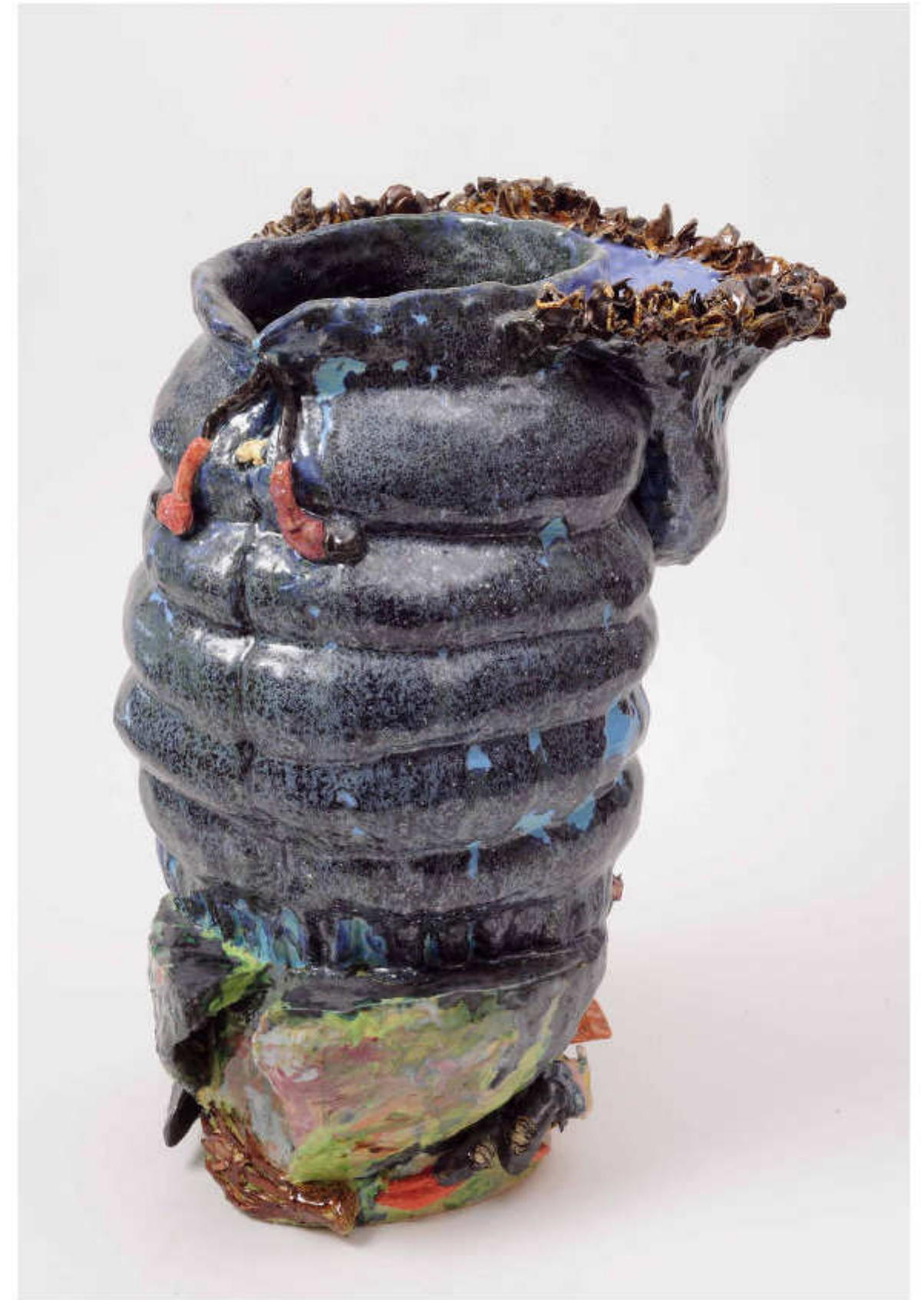
9/24 Daunenweste mit Fellkragen Höhe: 48 cm