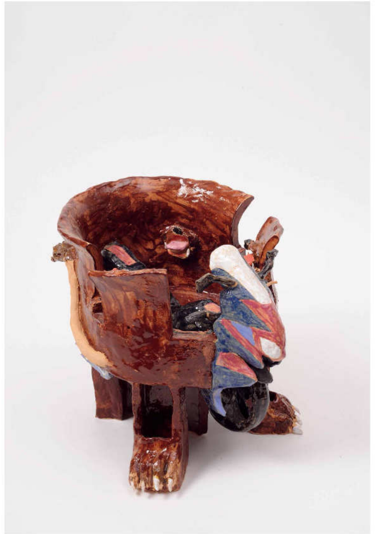
11/24 Motorradgebrüll Höhe: 27 cm