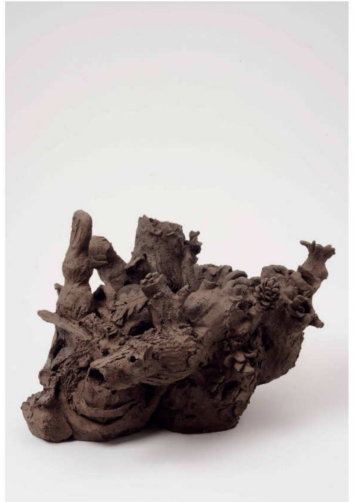
24/24 Heimat Höhe: 32 cm