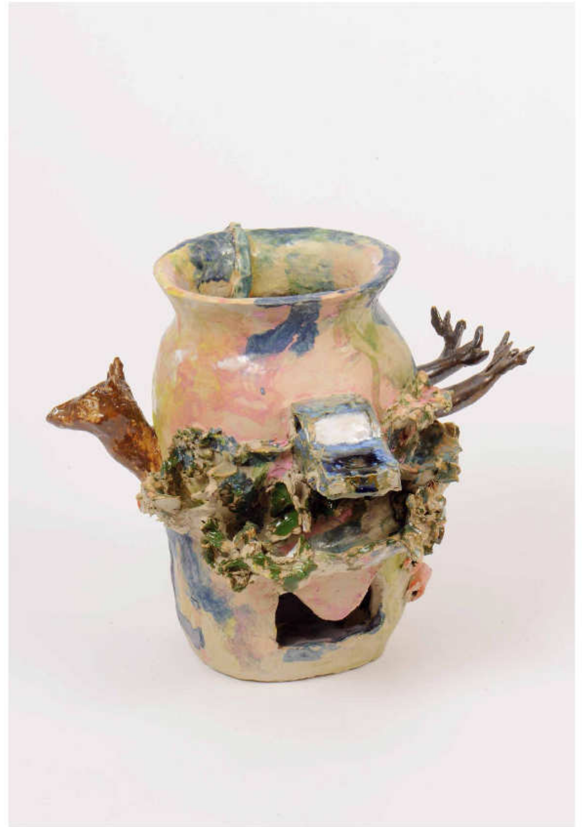
1/24 Nächtliche Begegnung auf der Bundesstraße Höhe: 22,5 cm