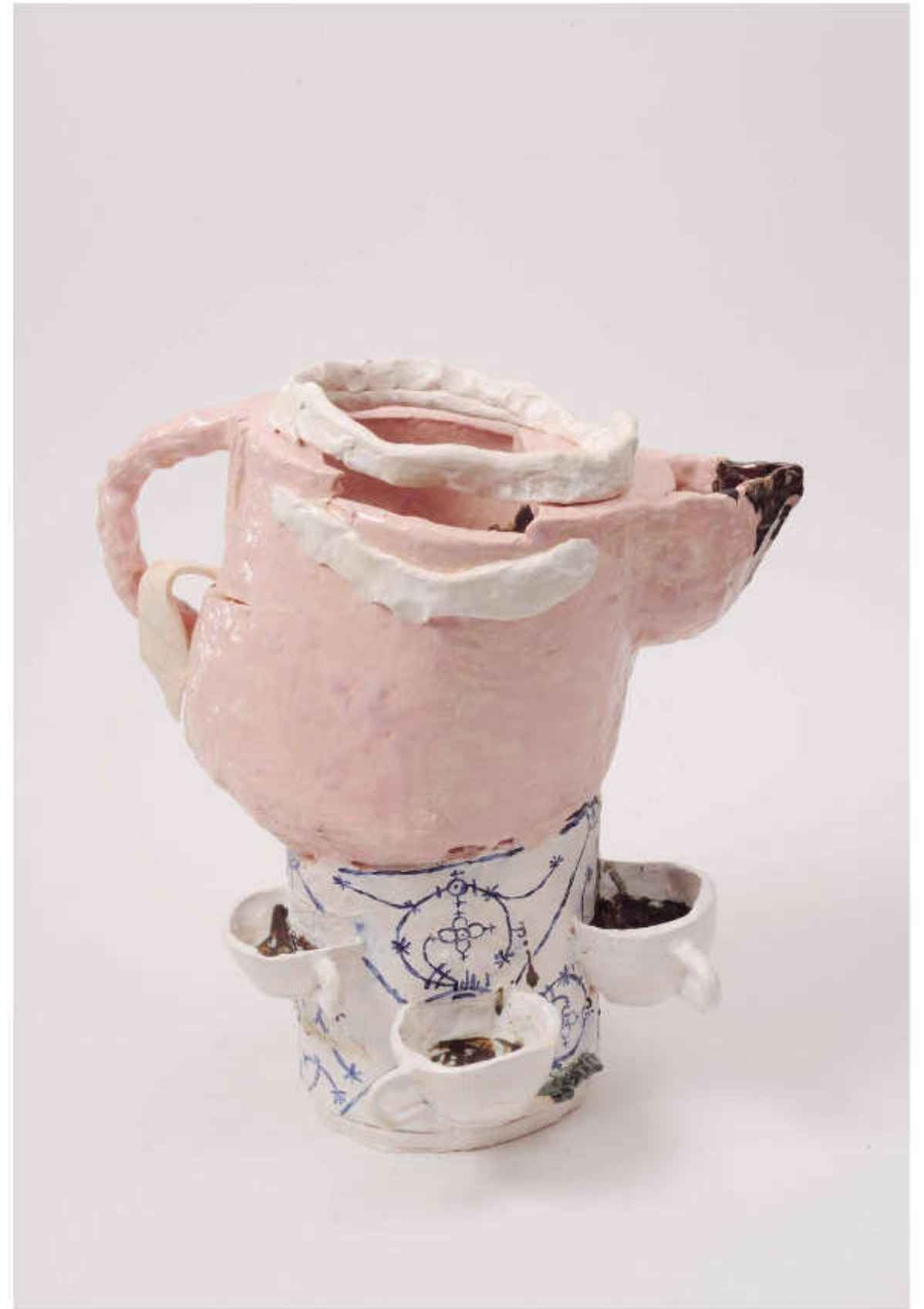
8/24 Nachmittags Höhe: 38 cm