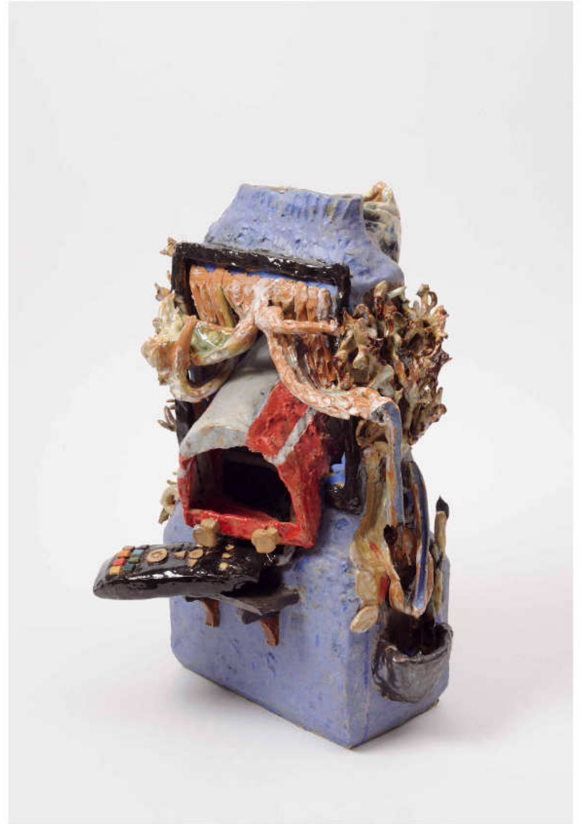
10/24 Unfall auf der Matscheibe Höhe: 42 cm