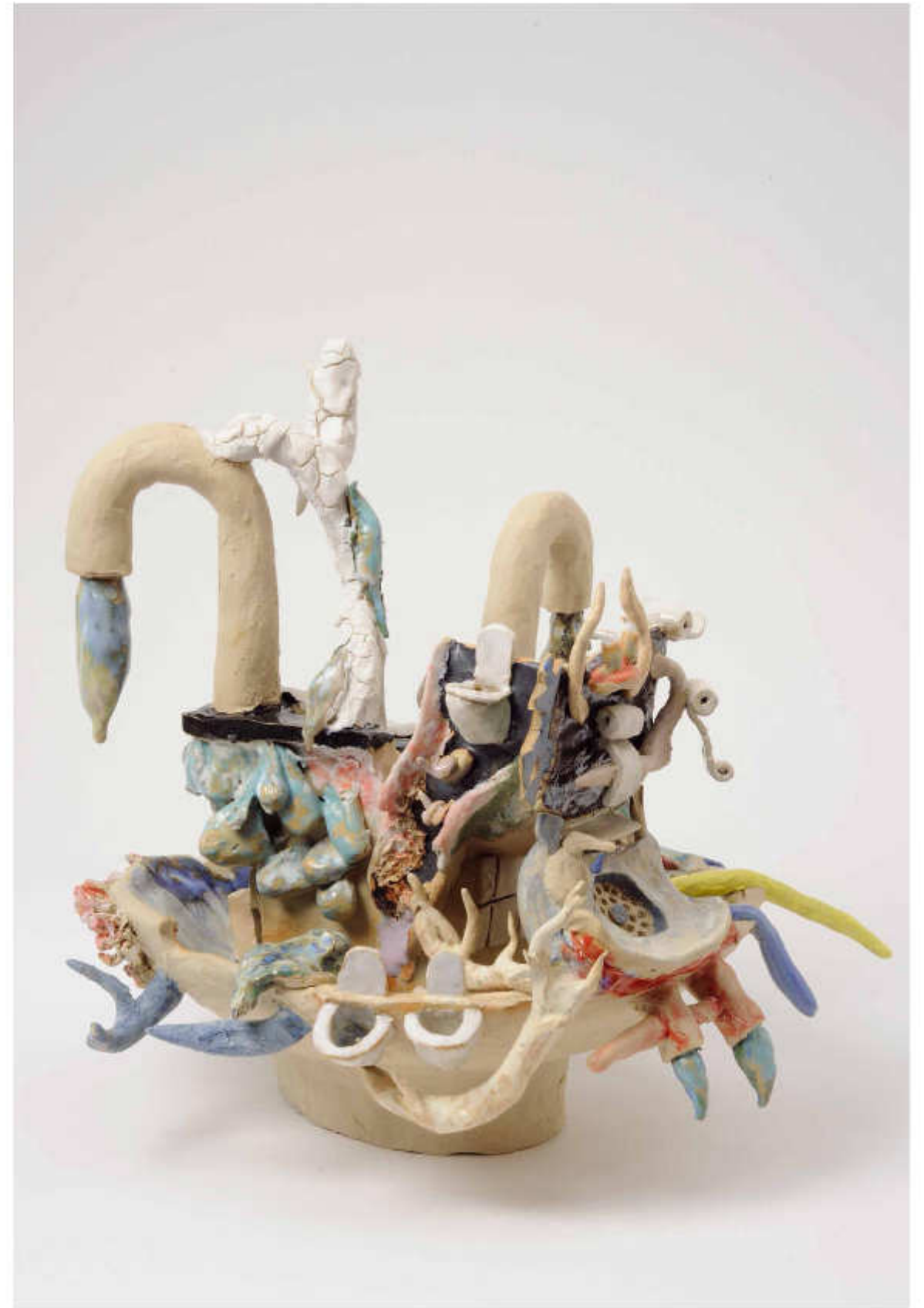
18/24 Badezimmer Höhe: 39 cm