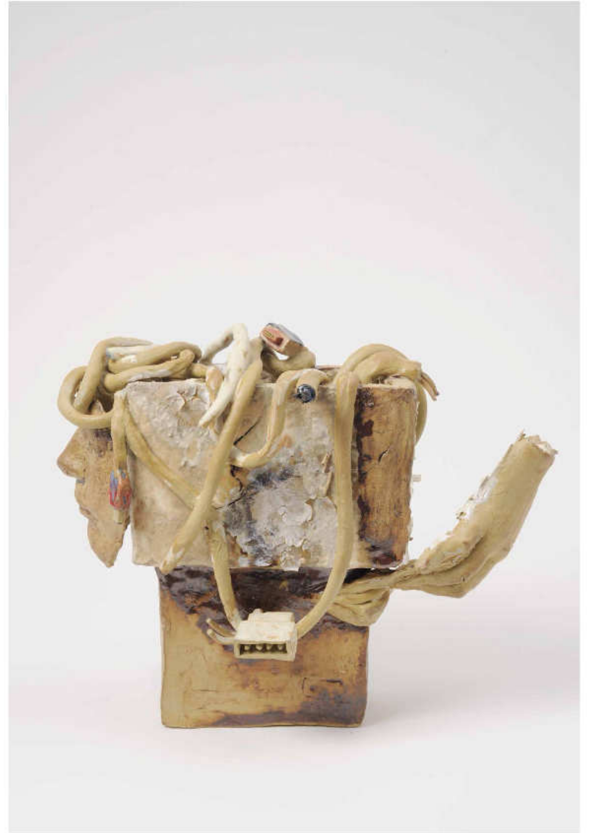
23/24 comfortably numb III Höhe: 29 cm