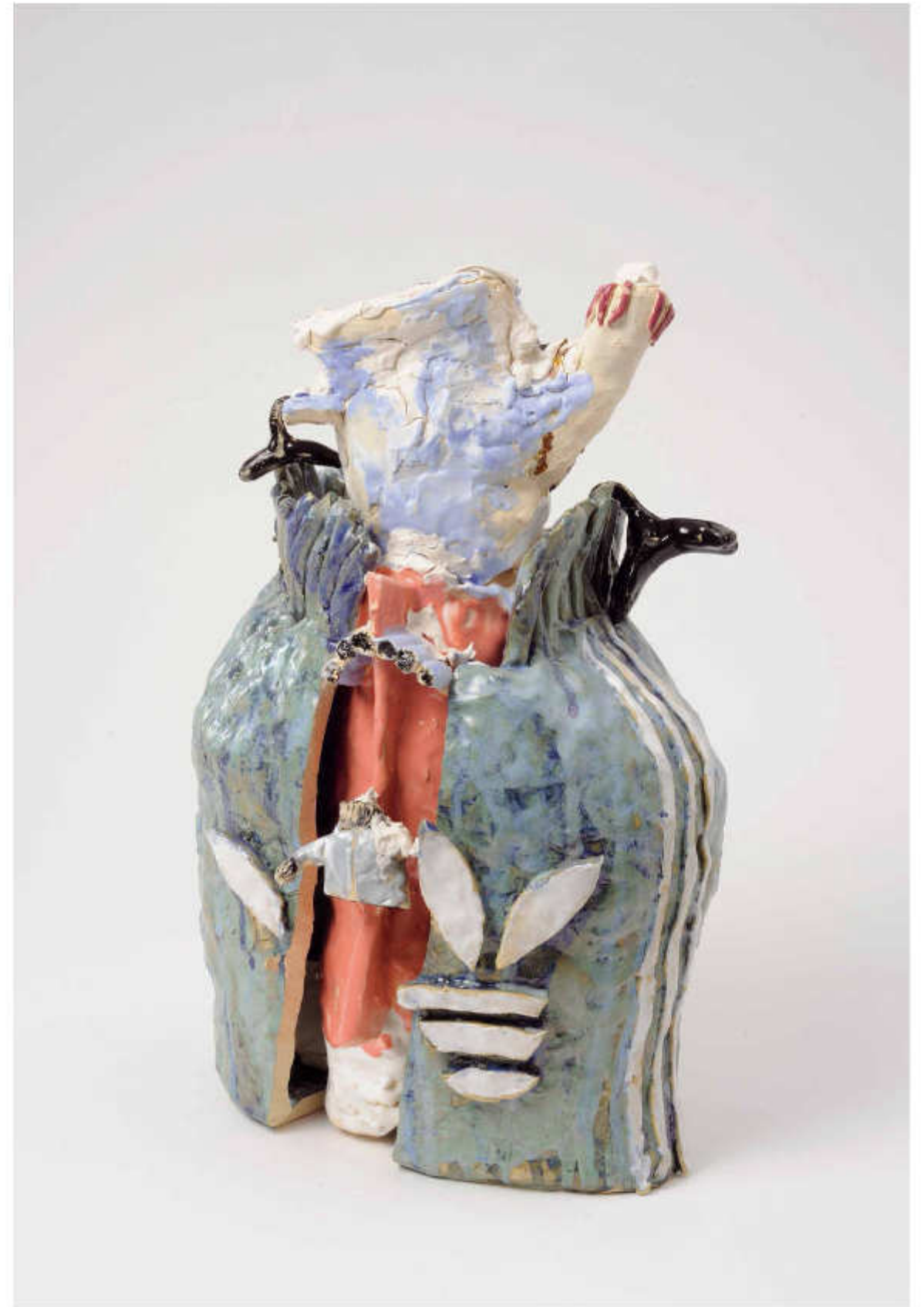
22/24 Zwei Kleiderbügel Höhe: 40 cm