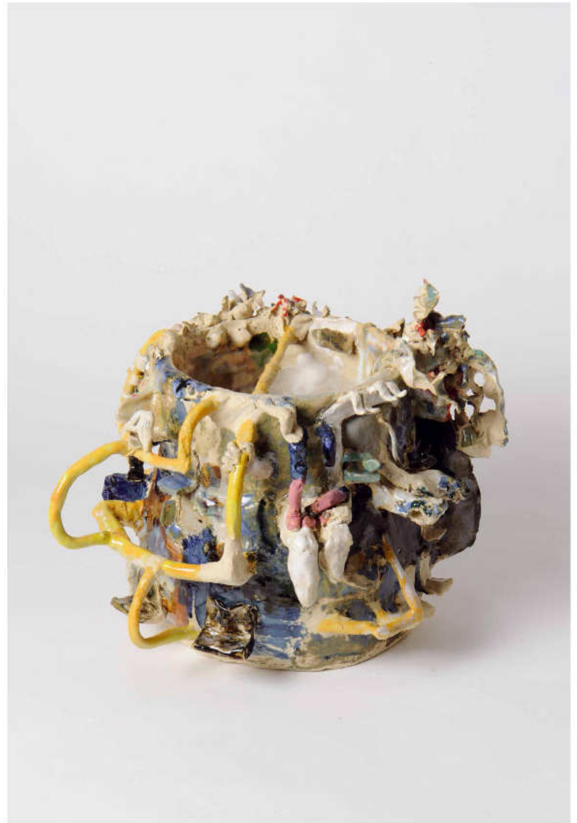
2|24 U-Bohn Höhe: 24 cm