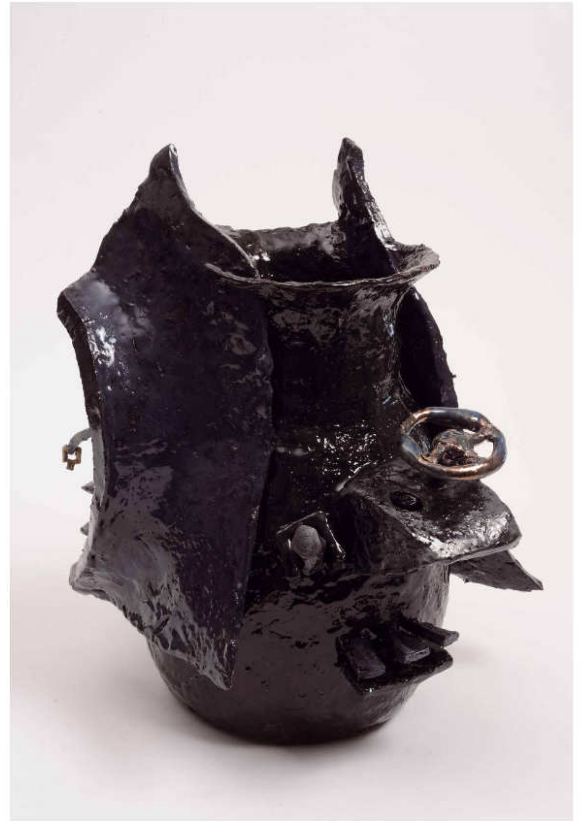
3/24 Auto Höhe: 40 cm