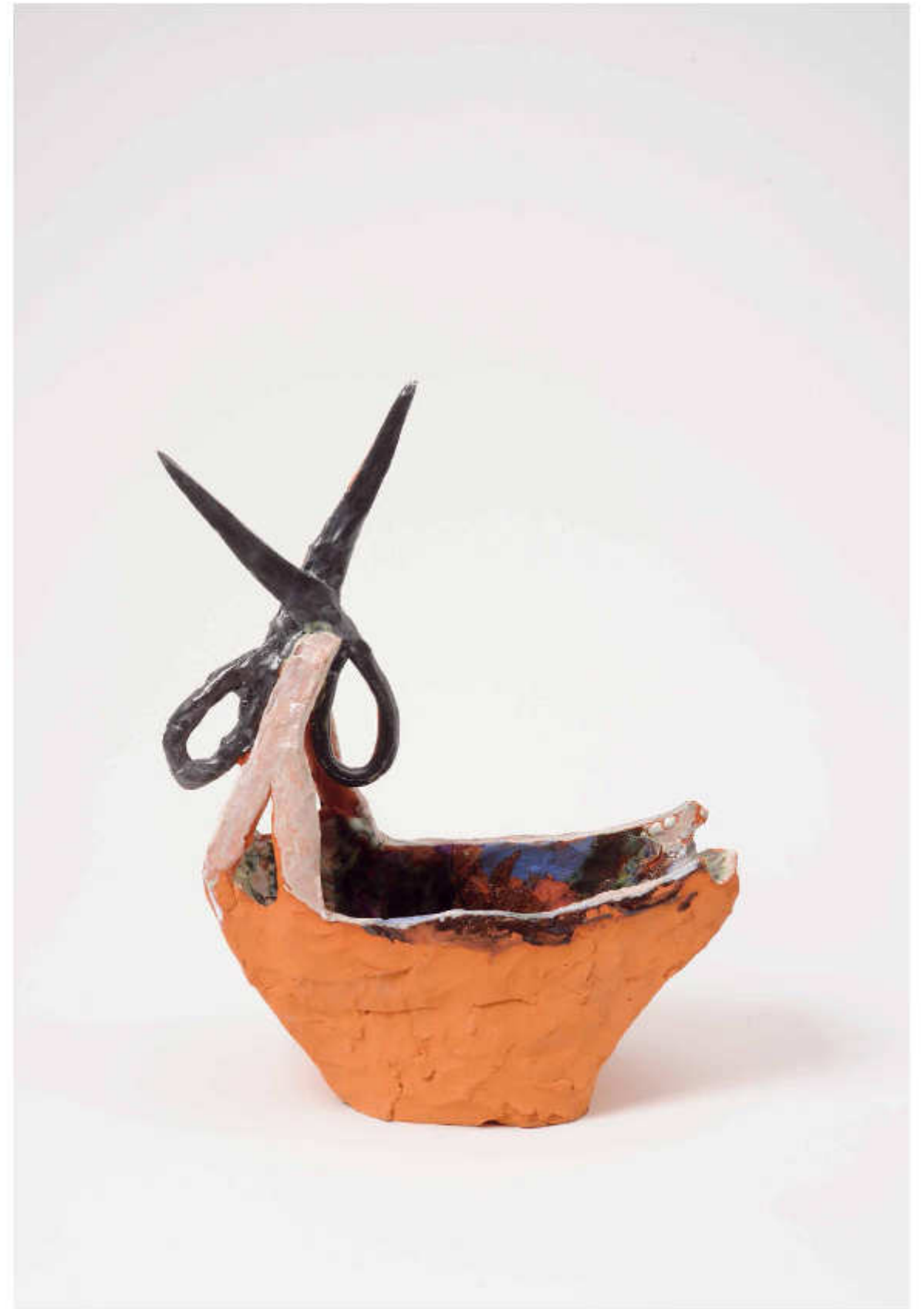
19/24 Aus dem Nähkästchen plaudern Höhe: 31 cm