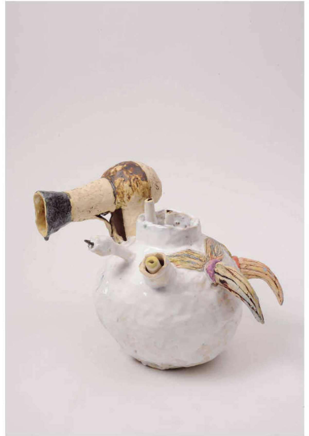
13/24 Föhnvase Höhe: 28 cm