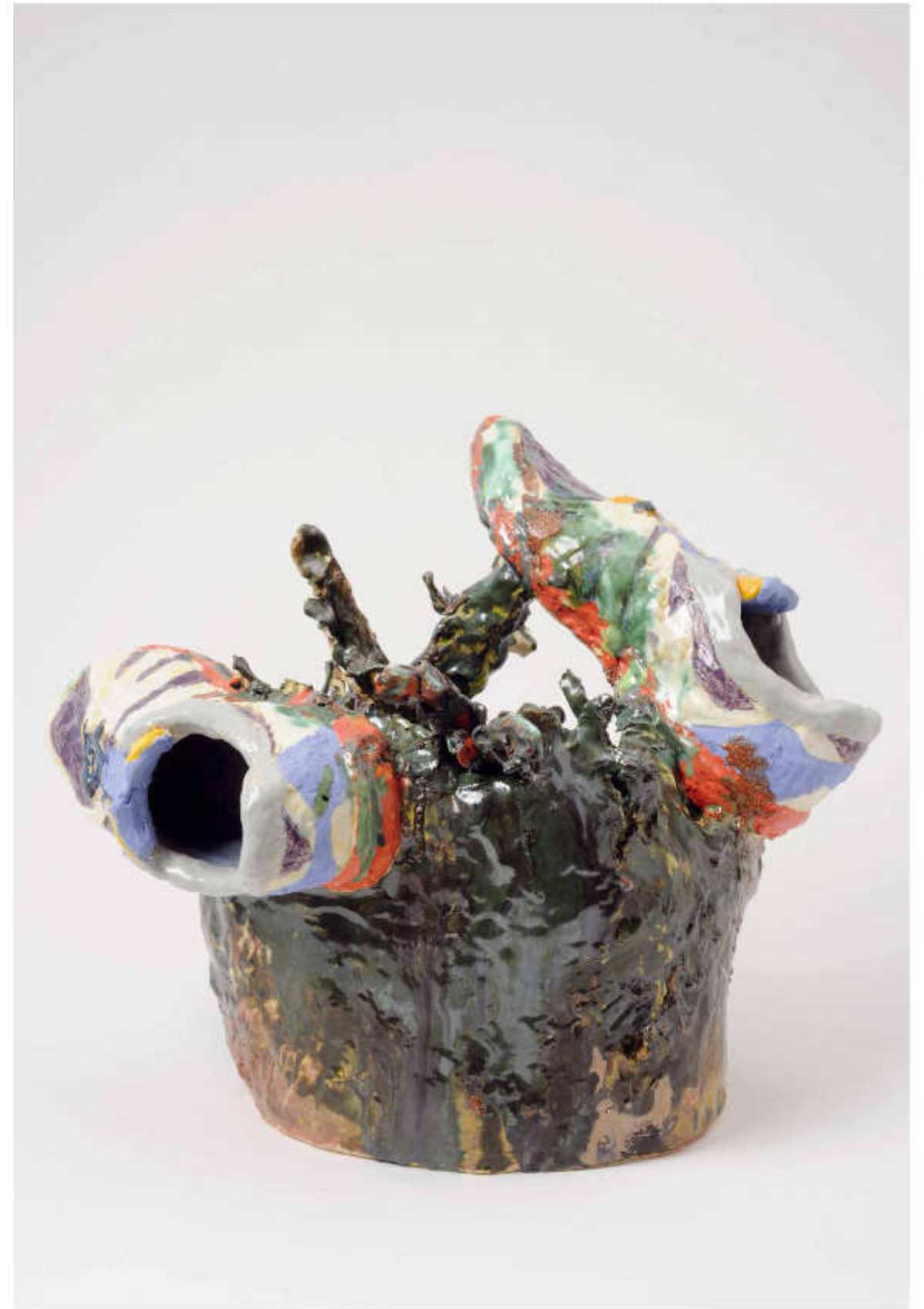
14/24 Unterholz Höhe: 36 cm